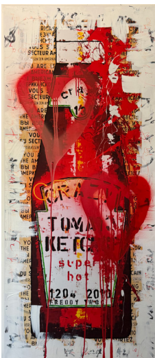
KETCHUP 60 X 138 CM 1.250 €