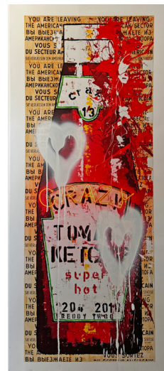
KETCHUP 60 X 138 CM 1.250 €