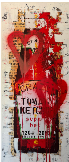
KETCHUP 60 X 138 CM 1.250 €