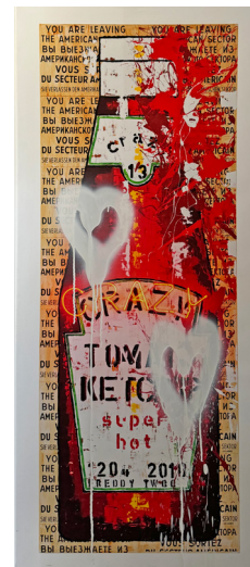
KETCHUP 60 X 138 CM 1.250 €