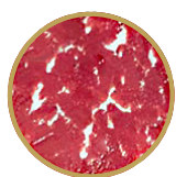
4 - 5 MARKET STYLE

Die verschiedenen Grade der Marmorierung bezeichnen die Verteilung von Fettgewebe im Fleisch. Die Marmorierung bestimmt dabei, wie aromatisch, zart und saftig das Steak wird.