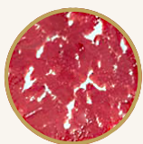
4 - 5 MARKET STYLE

Die verschiedenen Grade der Marmorierung bezeichnen die Verteilung von Fettgewebe im Fleisch. Die Marmorierung bestimmt dabei, wie aromatisch, zart und saftig das Steak wird.